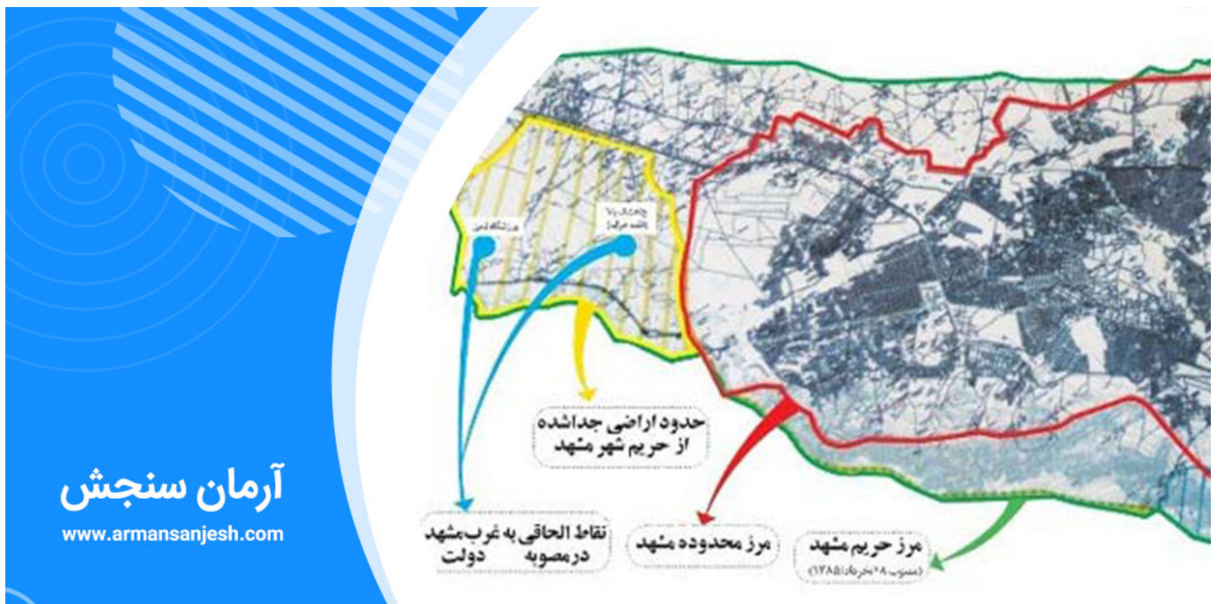
نقشه اراضی شهر مشهد

لازم است بدانیم که بر اساس تقسیمات شهرسازی، هریک از سکونتگاه‌های رسمی، اعم از شهر و روستا امروزه دارای نقشه شهرسازی در قالب طرح هادی، طرح جامع، طرح‌های موضعی و موضوعی هستند. طی دهه گذشته، در شهرهای زیر ۲۵ هزار نفر جمعیت و کلیه روستاها، طرح هادی شهری و روستایی تهیه گردیده است. به موجب قانون تعاریف محدوده و حریم شهر، روستا و شهرک و نحوه تعیین آن‌ها مصوب ۱۳۸۴/۱۰/۲۸ مجلس شورای اسلامی، تعاریف محدوده و حریم برای شهر و روستا آورده شده است: